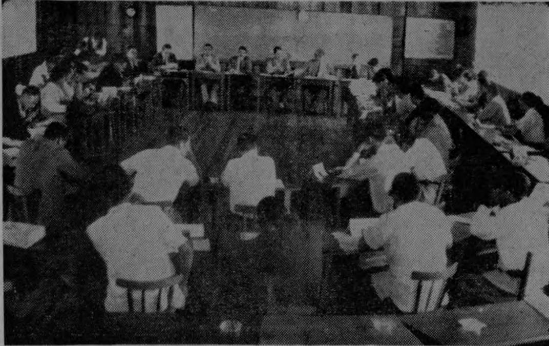
EN EL SEMINARIO DE JUVENTUDES de América Central y el Caribe, en Coronado, se inició esta mañana una Mesa Redonda, en la que participaron Representantes de los 3