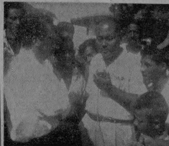
EN LAS DOS GRAFICAS DE G.M.O. ROMAN S., que nos han sido enviadas desde Puntarenas, puede verse a uno de los dirigentes explicando las razones de la huelga, y

tó: que considera que el partido de Liberación Nacional ha traído, con su política, el enfoque de los problemas económico-sociales, a base de luchas internacionales, por mejorar precios, y luchas nacionales para mejorar la justicia social y el desarrollo económico dentro del sistema democrático de Gobierno. Hizo un análisis rápido pero objetivo de la Pasa a la Pág. SEIS