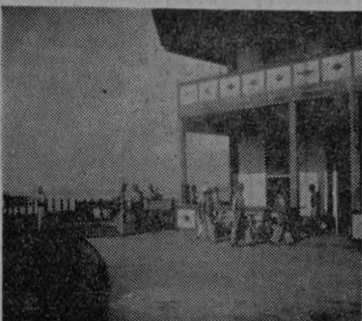
en la otra, a un grupo de Guardias Civiles resguardando el Muelle de aquel puerto desde hace varios días, armados, inclusive con emplazamientos de ametralladoras.